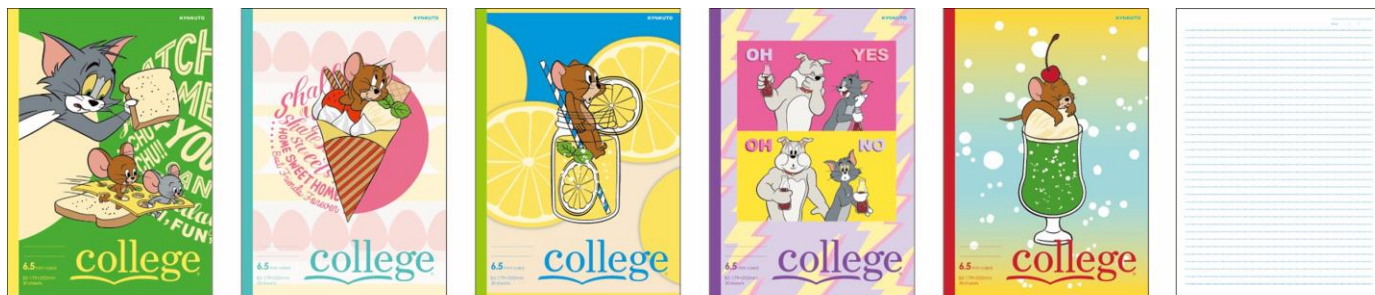
6.5mm 罫 34 行止罫 (ドット罫)