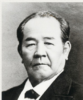
渋沢 栄一

この度、紳士なノート発売 10周年を記念し「# 渋沢を探せ Twitter キャンペーン」を本日 2022年 11月 1日より実施いたします。また、本キャンペーンに合わせ、プレミアム CD ノートについている帯のデザインの紳士が“渋沢栄一”になった特別版が店頭に並びます。