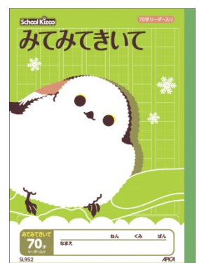
かわいらしい姿で人気のシマエナガがモチーフ