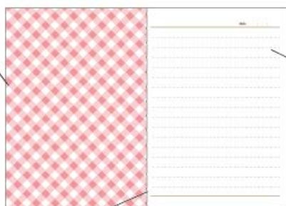
丈夫な糸綴じ製本