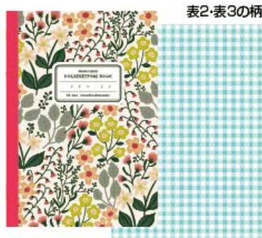
アイボリー A5家計簿