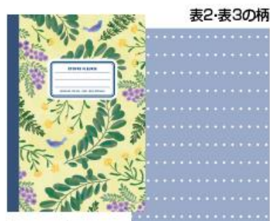
レモンイエロー B6ノート