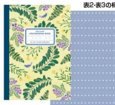
レモンイエロー A5家計簿